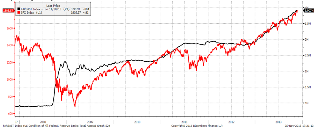
Aktywa FED [bln USD] na tle S&P500- lewa skala