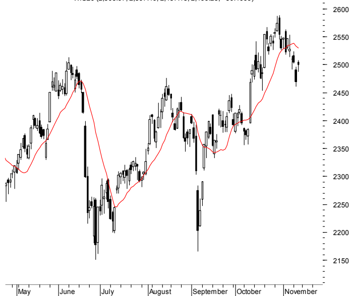
WIG20 (2.505.07, 2.507.49, 2.487.18, 2.499.23, +30.4099)