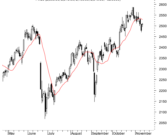
FW20 (2.505.00, 2.513.00, 2.495.00, 2.510.00, +32.0000)