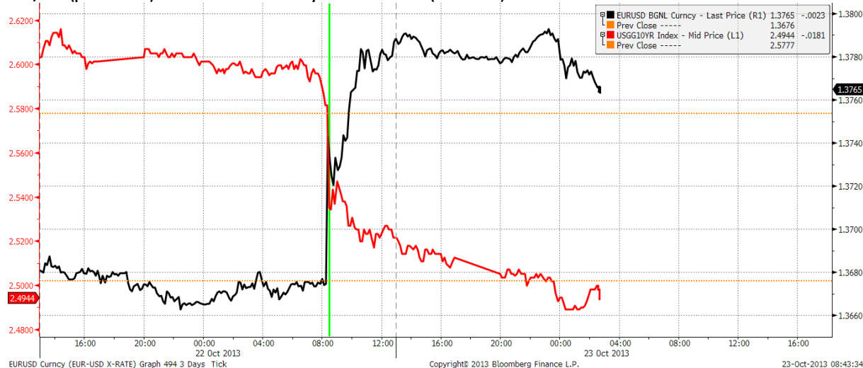
EUR/USD (prawa skala) na tle rentowności amerykańskich 10-latek (lewa skala)

Na słabszy od oczekiwań raport z amerykańskiego rynku pracy (148 tys. vs oczek. 180 tys.) rynek zareagował silnym osłabieniem dolara (z 1,3670 na blisko 1,38 EUR/USD) i spadkiem rentowności 10-letnich obligacji (z 2,6% na 2,5%). W ten sposób na rynku odżyły nadzieje na przedłużenie programu QE przez FED. Co ciekawie, silny ruch na obligacjach pojawił się już pół godziny przed oficjalnym ogłoszeniem danych. Nieco później zareagowały waluty.