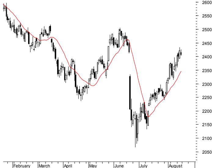
WIG20 (2,457.38, 2,463.17, 2,443.88, 2,445.60, -15.6199)