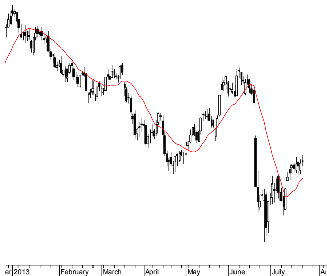
FW20 (2,269.00, 2,284.00, 2,259.00, 2,270.00, +6.00000)

Aktualna pozycja – długa, sygnał otwarcia krótkiej- 2222 Ostatnia zmiana sygnału z krótkiej na długą- 2176 Najbliższe poziomy oporu: 2285 2337 2400 2413 Najbliższe poziomy wsparcia: 2232 2200 2170 2133