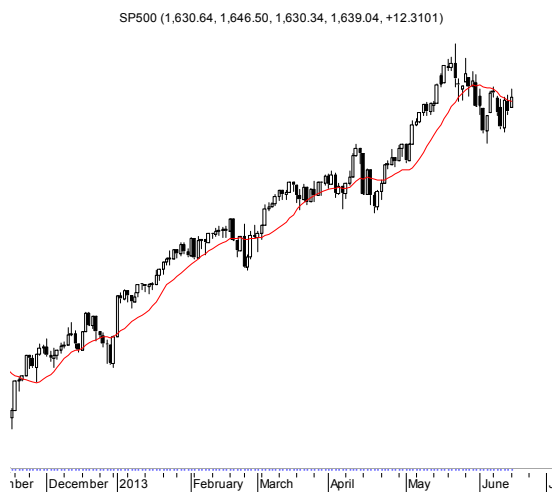
SP500 (1,630.64, 1,646.50, 1,630.34, 1,639.04, +12.3101)