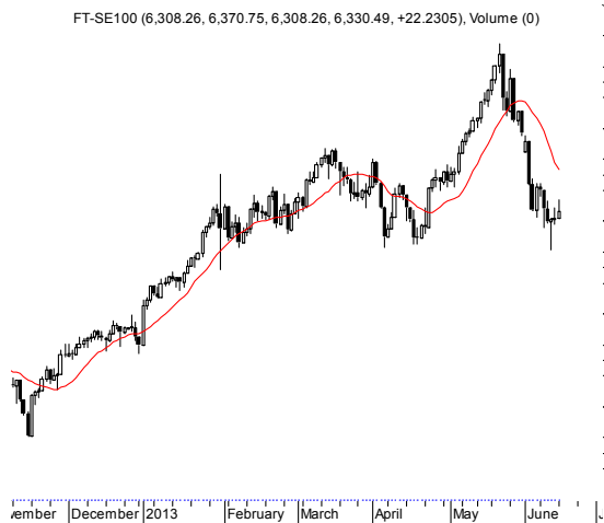
FT-SE100 (6,308.26, 6,370.75, 6,308.26, 6,330.49, +22.2305), Volume (0)