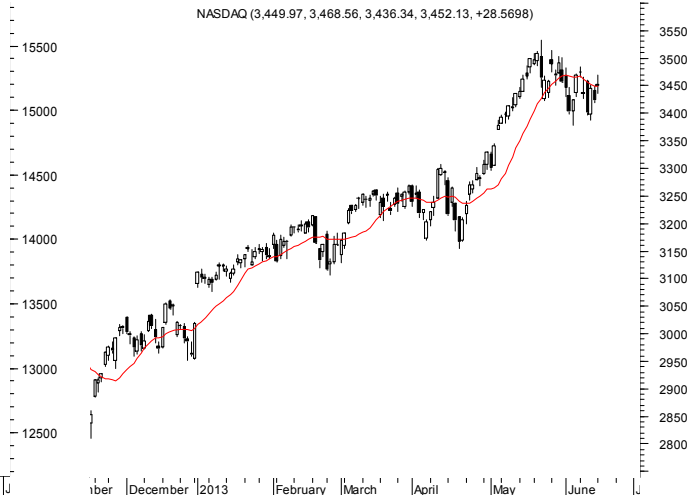
NASDAQ (3,449.97, 3,468.56, 3,436.34, 3,452.13, +28.5698)