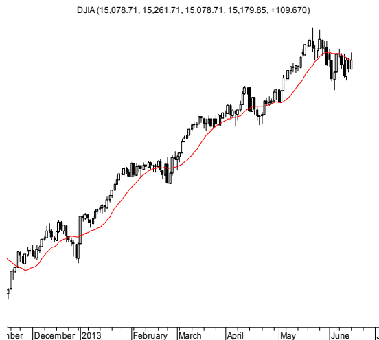
DJIA (15,078.71, 15,261.71, 15,078.71, 15,179.85, +109.670)