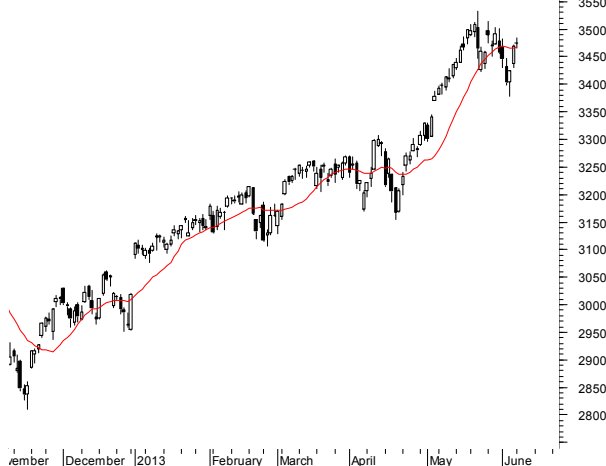
NASDAQ (3,475.68, 3,484.81, 3,465.54, 3,473.77, +4.55005)