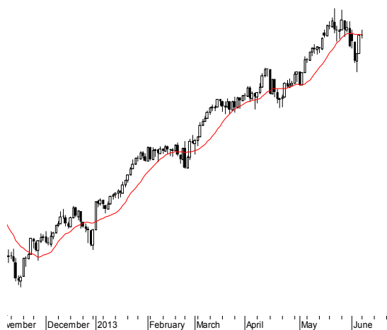
DJIA (15,247.81, 15,300.64, 15,211.25, 15,238.59, -9.53027)