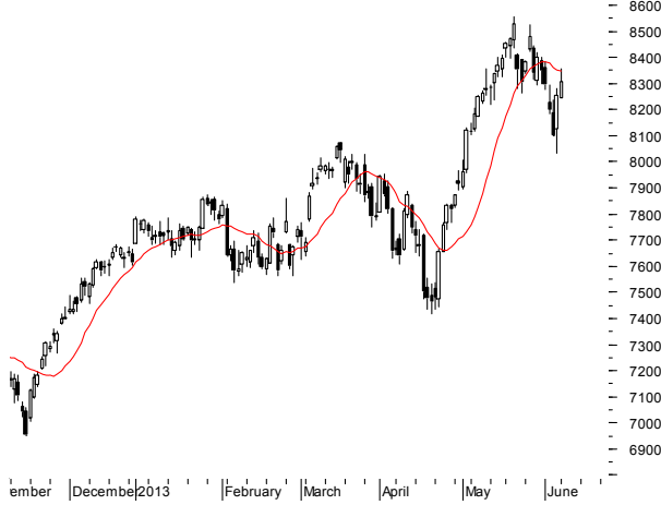
DAX (8,246.04, 8,355.79, 8,245.94, 8,307.69, +53.0107)