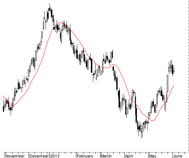
WIG20 (2.453.83, 2.467.14, 2.451.90, 2.462.92, +19.2700)