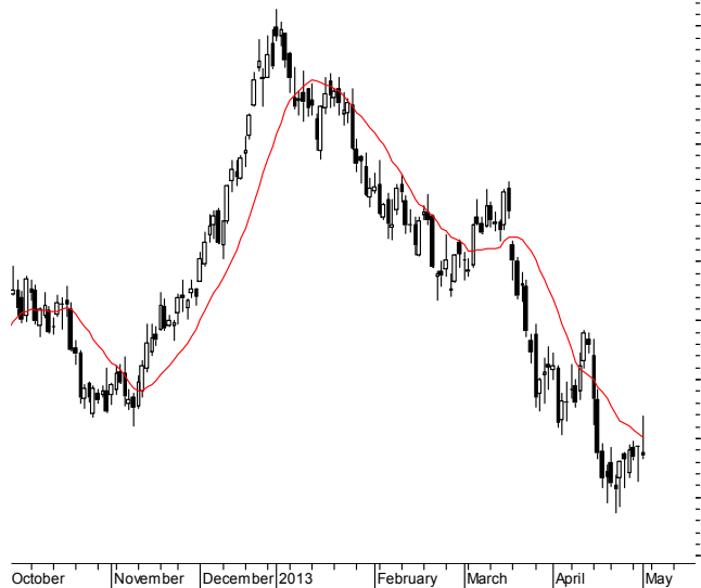
WIG20 (2.315.66, 2.329.23, 2.305.25, 2.305.90, -13.2500)