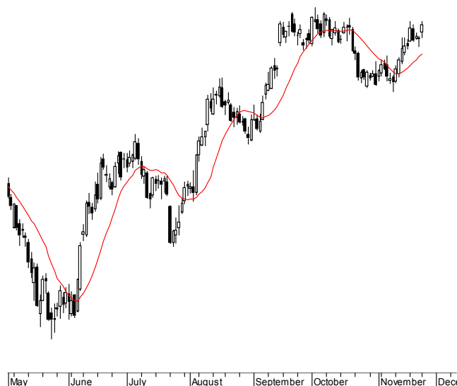
WIG20 (2,398.63, 2,413.28, 2,388.54, 2,405.82, +7.43018)