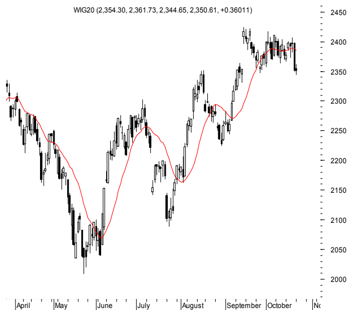
WIG20 (2,354.30, 2,361.73, 2,344.65, 2,350.61, +0.36011)