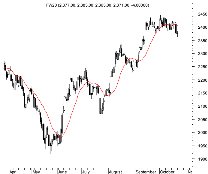
FW20 (2,377.00, 2,383.00, 2,363.00, 2,371.00, -4.00000)

Najbliższe poziomy wsparcia: 2330 2290 2228 2200